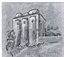
chiesa di San Marco